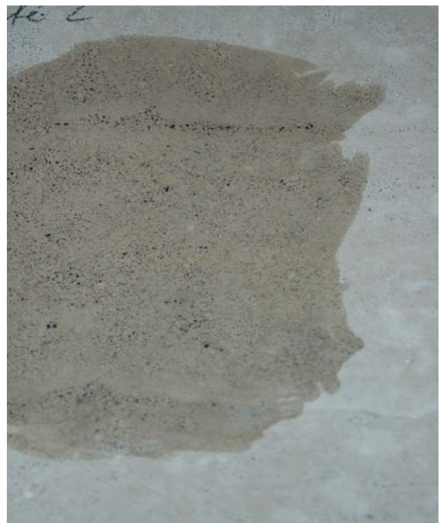
Benetzung mit Wasser Korn sichtbar