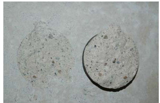
Korn am Ausriss sichtbar